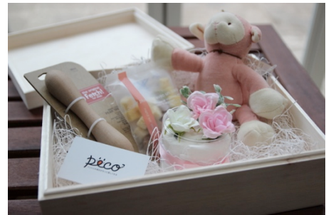
<PECOBOX for WEDDING>

T&Gは、“一顧客一担当制”や“一軒家貸し切り”などのサービスを提供し、一組一組心を込めてウェディングを提供するハウスウェディングのパイオニアです。また、ペットのパターンオーダー衣装「Pet Dress」の販売など様々なオリジナル商品の開発を行っています。